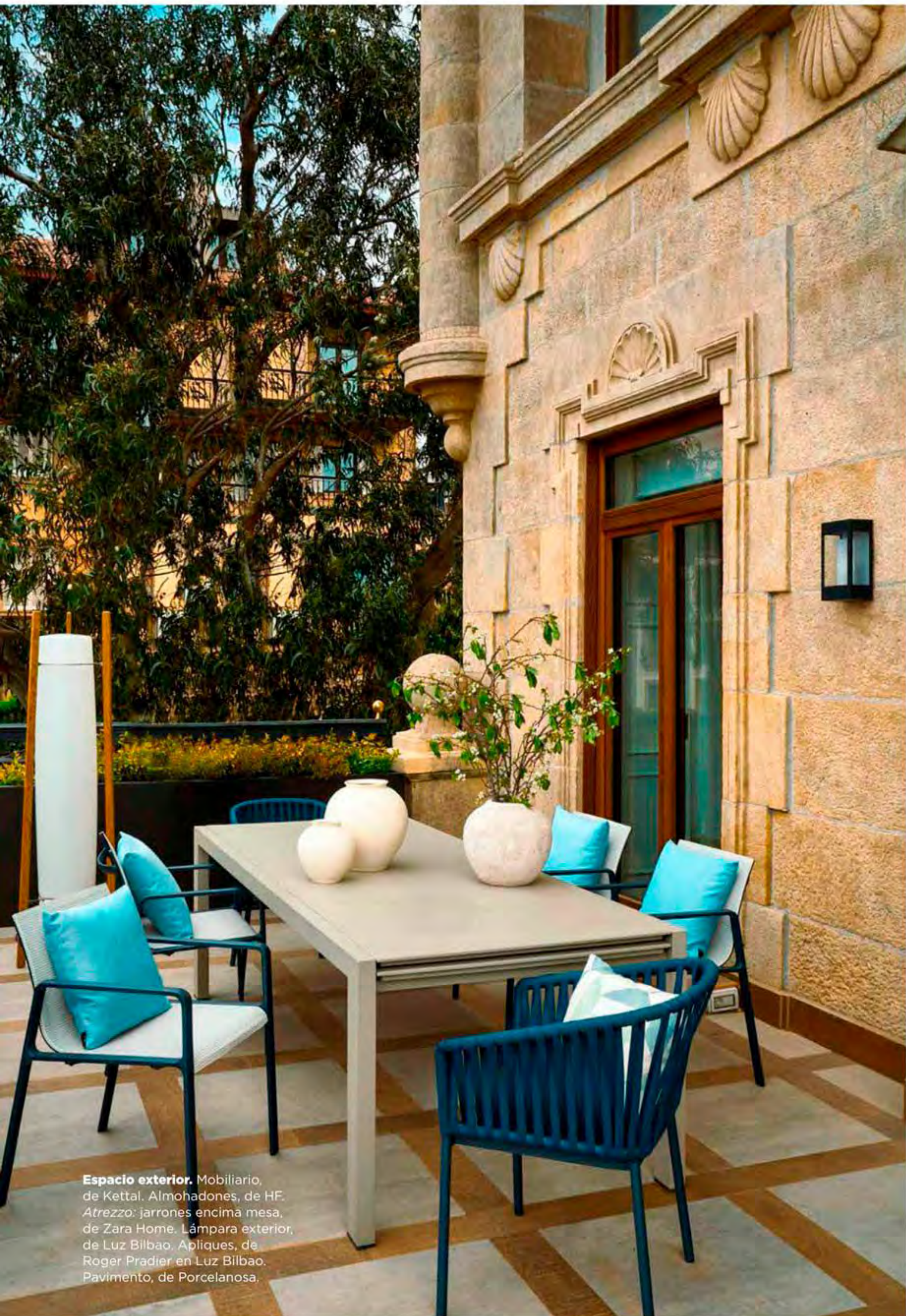
Espacio exterior. Mobiliario, de Kettal. Almohadones, de HF. Atrezzo: jarrones encima mesa, de Zara Home. Lámpara exterior, de Luz Bilbao. Apliques, de Roger Pradier en Luz Bilbao. Pavimento, de Porcelanosa.