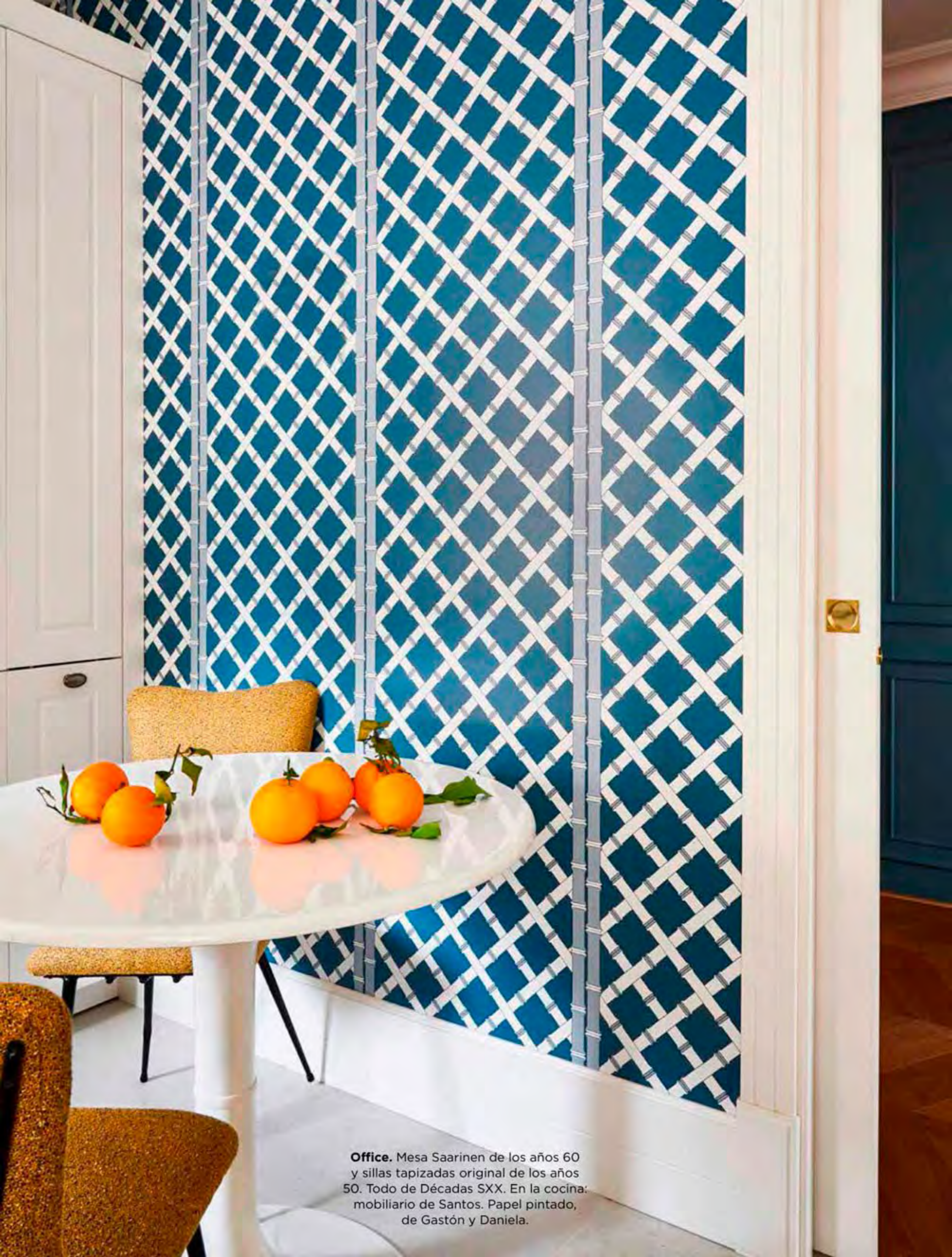
Office. Mesa Saarinen de los años 60 y sillas tapizadas original de los años 50. Todo de Décadas SXX. En la cocina: mobiliario de Santos. Papel pintado, de Gastón y Daniela.